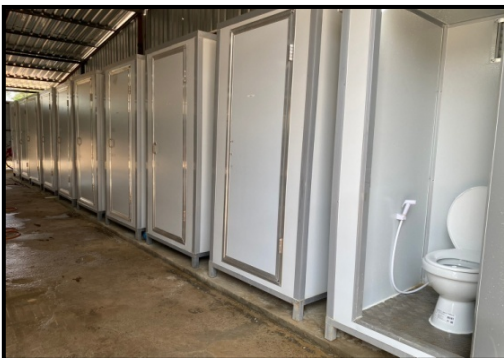
รูปที่ 2-30 ห้องน้ำคนงานบริเวณพื้นที่โครงการ