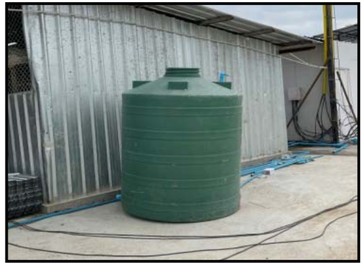
รูปที่ 2-33 ถังสำรองน้ำใช้