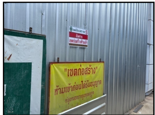
รูปที่ 2-14 ป้ายอันตรายห้ามเข้าเขตก่อสร้าง