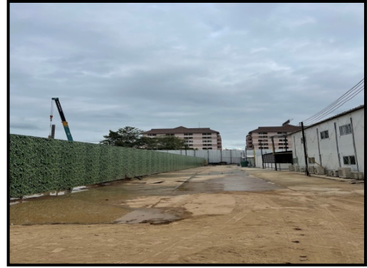
รูปที่ 2-18 พื้นที่สำหรับจอดรถบรรทุกไว้ในพื้นที่