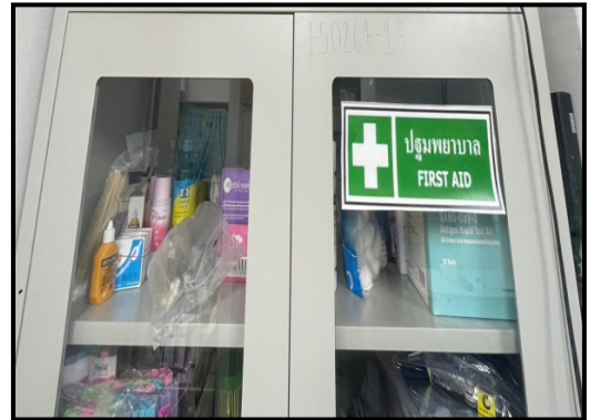
รูปที่ 2-35 จุดห้องปฐมพยาบาล (First aid room)