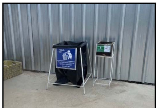
รูปที่ 2-16 ป้ายจุดสูบบุหรี่ ป้ายที่ปักสูบบุหรี่