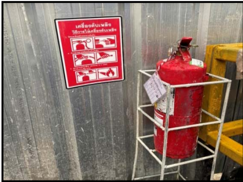
รูปที่ 2-17 ถังดับเพลิงเคมีแต่ละจุดภายในโครงการ