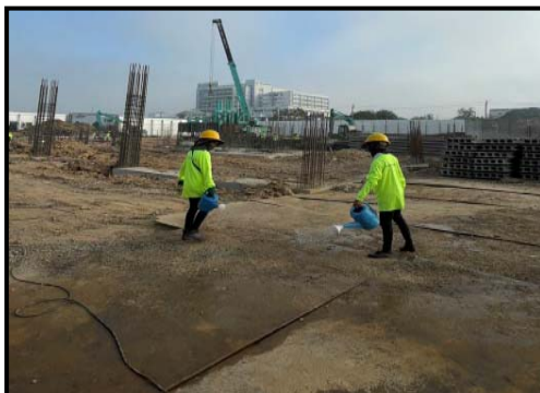
รูปที่ 2-7 กิจกรรมฉีดพรมน้ำบริเวณพื้นที่ก่อสร้าง