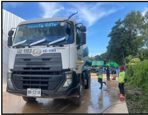
รูปที่ 2-9 กิจกรรมทำความสะอาดล้อรถบรรทุก