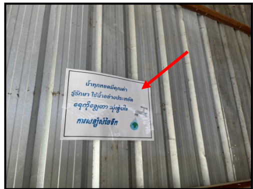
รูปที่ 2-12 ป้ายรณรงค์การประหยัดน้ำ