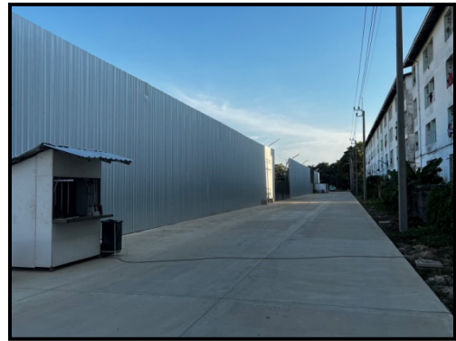
รูปที่ 2-2 จัดทำรั้ว Metal Sheet ความสูง 6 เมตร