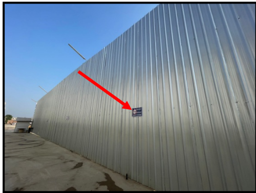
รูปที่ 2-11 ป้ายรณรงค์ให้ดับเครื่องยนต์ขณะไม่ใช้งาน