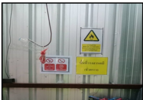
รูปที่ 2-15 ป้ายอันตราย ห้ามสูบบุหรี่ ห้ามทำให้เกิดประกายไฟ