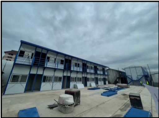
รูปที่ 2-34 บ้านพักคนงาน