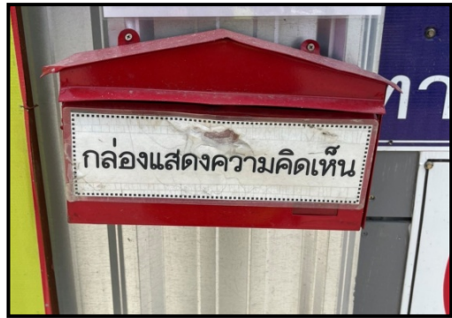
รูปที่ 2-25 ติดตั้งกล่องรับเรื่องราวร้องเรียน