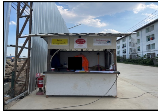
รูปที่ 2-29 ป้อมยาม