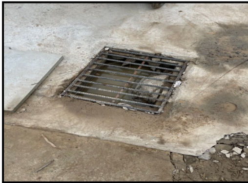
รูปที่ 2-22 ท่อระบายน้ำคอนกรีตเสริมเหล็กชั่วคราว