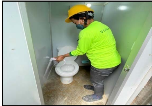
รูปที่ 2-31 กิจกรรมทำความสะอาดห้องน้ำ