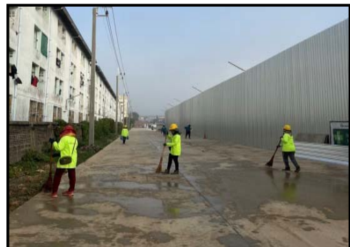
รูปที่ 2-8 กิจกรรมทำความสะอาดบริเวณพื้นที่โครงการ