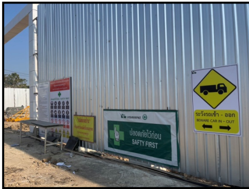
รูปที่ 2-3 ติดตั้งป้ายแสดงเขตพื้นที่ก่อสร้าง