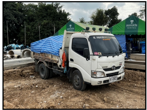
รูปที่ 2-10 ผ้าใบปิดคลุมกระบะหลังรถบรรทุกทุกครั้งที่มีการขนวัสดุก่อสร้างเข้า-ออกพื้นที่โครงการ