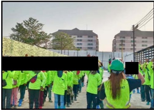
รูปที่ 2-26 อบรมคนงานก่อนเข้าปฏิบัติงาน (Safety Talk)