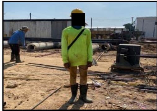
รูปที่ 2-27 คนงานก่อสร้างแต่งกายชุดปฏิบัติงาน