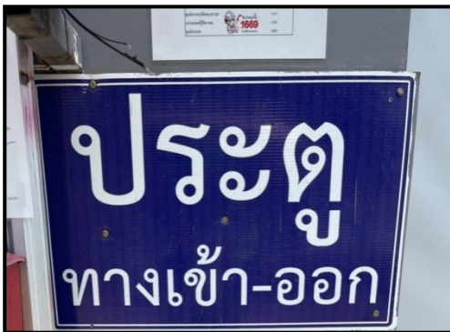
รูปที่ 2-5 ป้ายแสดงทางเข้า-ออกโครงการ