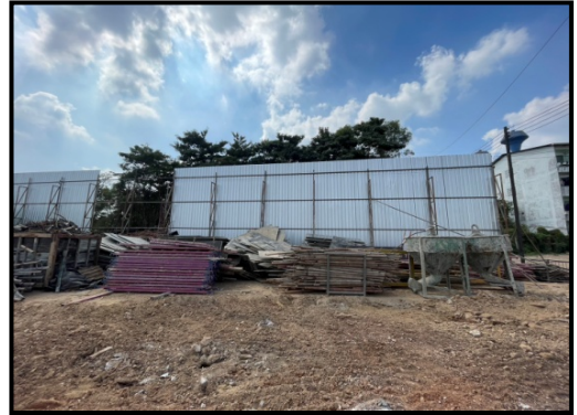
รูปที่ 2-21 พื้นที่เก็บเศษวัสดุก่อสร้าง