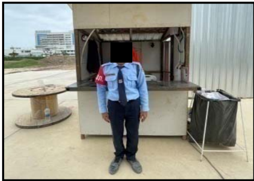
รูปที่ 2-28 เจ้าหน้าที่รักษาความปลอดภัยประจำหน้าโครงการ