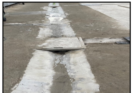
รูปที่ 2-23 รางระบายน้ำคอนกรีต