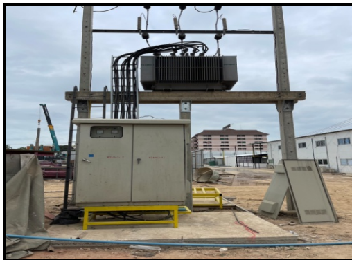
รูปที่ 2-20 ติดตั้งหม้อแปลงไฟฟ้าชั่วคราว