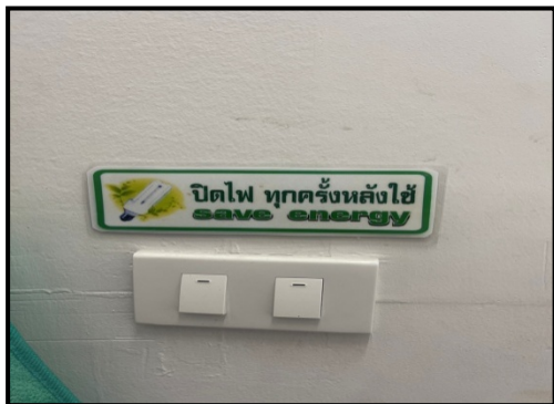
รูปที่ 2-13 ป้ายรณรงค์การประหยัดไฟ