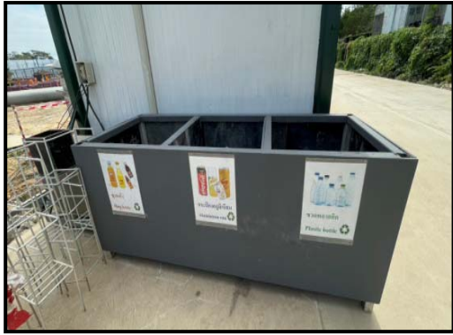
รูปที่ 2-32 ถังขยะภายในโครงการ