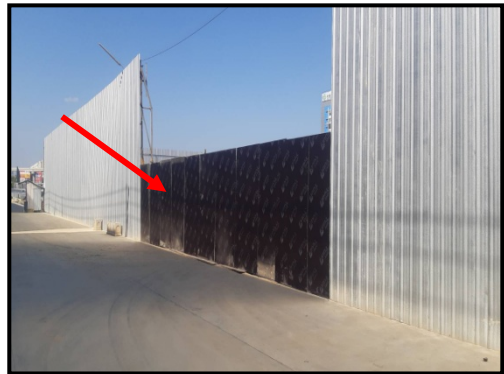
รูปที่ 2-4 ประตูทางเข้า-ออกโครงการปิดที่ตลอดเวลา