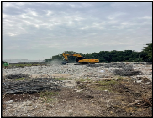
รูปที่ 2-1 พื้นที่ขณะรื้อถอน