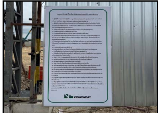
รูปที่ 2-6 ป้ายตารางมาตรการบริเวณหน้าโครงการ